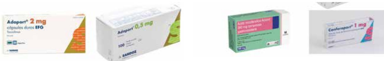
Alcuni farmaci equivalenti che sostituiscono quelli con il brand con il brevetto scaduto costano la metà

Questa soluzione che, in via sperimentale, abbiamo