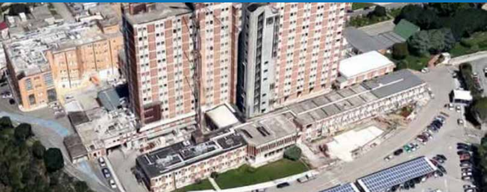
Ospedale S. Francesco di Nuoro

Richiesti percorsi riservati per i trapiantati nei vari ospedali della Sardegna