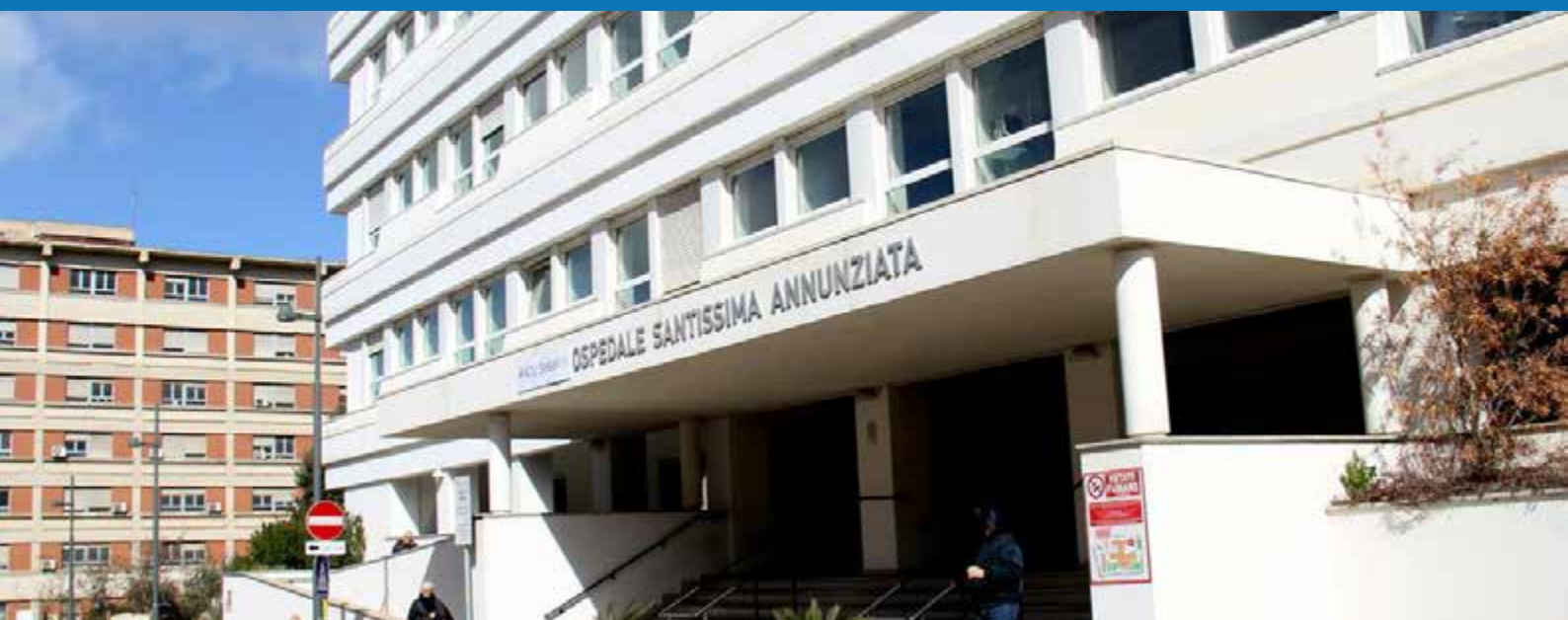
Ospedale S.S. Annunziata di Sassari