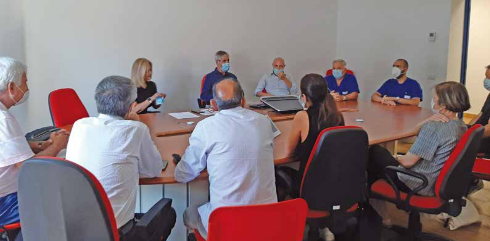
SASSARI -Incontro dei volontari della Prometeo Aitf Regionali e Provinciali con la Direzione dell'AOU

ti nelle cure loro destinate. In particolare, per tre obiettivi: miglioramento dell'assistenza; cure dentarie; protesi auricolari.