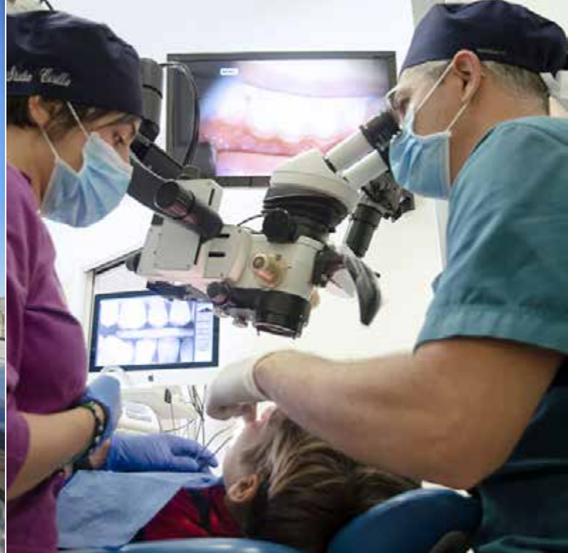
Cure dentarie per i trapiantati richieste a Nieddu

Un altro problema comune alla stragrande maggioranza dei trapiantati è l'aver avuto una bonifica del cavo orale, con l'asportazione di denti, prima del trapianto, ma non potersi permettere di pagare le cure per ripristinare la dentatura completa, con evidenti disagi e problemi in fase sia di masticazione che di digestione. Da qui la nostra proposta, più volte reiterata, di finanziare un progetto per offrire tali cure gratuitamente o a prezzo ridotto ai trapiantati residenti in Sardegna che ne facciano richiesta presso le strutture sanitarie pubbliche di Odontostomatologia (ospedali e cliniche universitarie). Nell'incontro avuto un anno fa, la nostra proposta è stata valutata favorevolmente da Lei, assessore Nieddu; su Sua indicazione abbiamo rivolto una richiesta per un intervento da 300mila euro all'assessore alla Programmazione Fasolino senza, però, aver avuto ancora una sua risposta. Nel frattempo, abbiamo chiesto un pa-