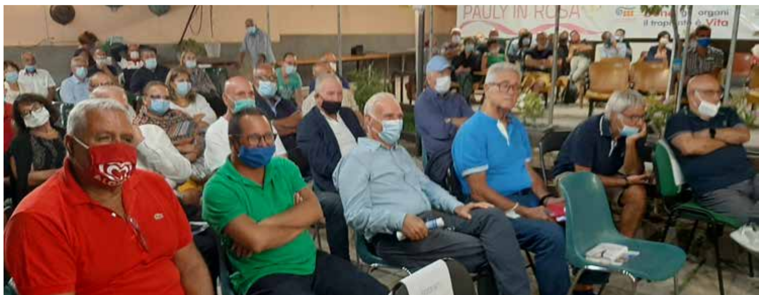
Diversi ex giocatori rossoblu del settore giovanile del Cagliari presenti a Monserrato per Telese