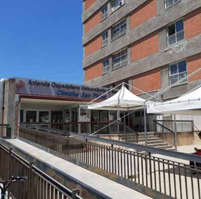
Sassari - Cliniche di S.Pietro della AOUSassari

proposto all'AOU per i soli trapiantati seguiti dal Centro trapianti di fegato e pancreas di Cagliari dovrebbe, a nostro parere, essere estesa a tutti i trapiantati e replicata anche in altri territori, in primis la provincia di Nuoro (piuttosto lontana da Cagliari e meno ben collegata delle province di Oristano e Sud-Sardegna), coinvolgendo le varie ASSL o almeno i maggiori presidi ospedalieri.