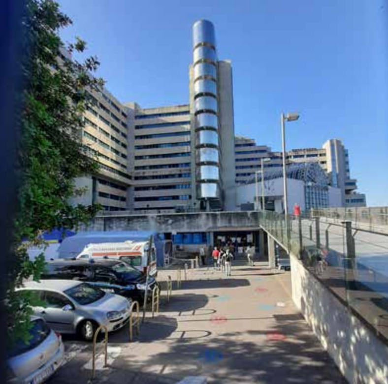
Ospedale "G. Brotzu" sede dei Centri trapianti sardi

ritmi più "dilatati", ragion per cui più di uno ha raccomandato ai pazienti provenienti da altre regioni di individuare un Centro trapianti di riferimento più vicino. Oltre a queste raccomandazioni, sono da mettere in preventivo i nuovi "ingressi" legati alle libere scelte dei pazienti sardi, stanchi delle trasferte e, in questo periodo, preoccupati di doversi recare in aeroporti e ospedali con maggiori flussi di persone.